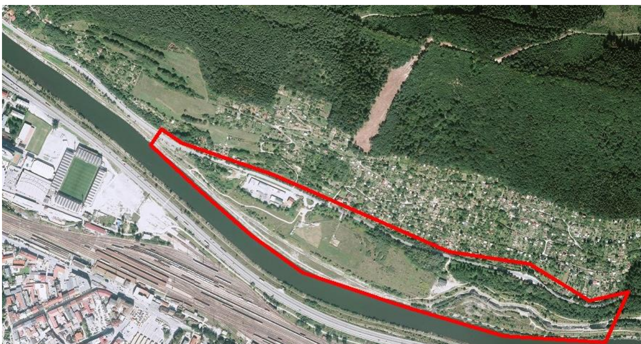
Vymedzené územie areálu športu Dubeň

3.1 Cieľom je výber spracovateľa urbanistickej štúdie riešeného územia a projektu multifunkčnej športovej haly pre územné rozhodnutie a stavebné povolenie. Situovanie Areálu športu Dubeň na riešené územie je v súlade s platným ÚPN-M Žilina Zmeny a doplnky č.2 z r. 2015 ( www.zilina.sk ). V súčasnosti je riešené územie temer nezastavané. V jeho západnej časti sa nachádza areál Správy ciest Žilinského VÚC – údržba ciest v správe ŽSK a sklad posypových materiálov. Na opačnom konci, na východnej strane v smere na Tepličku nad Váhom sa nachádza objekt Lodenice a vodácky areál vo väzbe na biokoridor – derivačný potok a rybochod – prítok Váhu vybudovaný pri výstavbe Vodného diela Žilina.